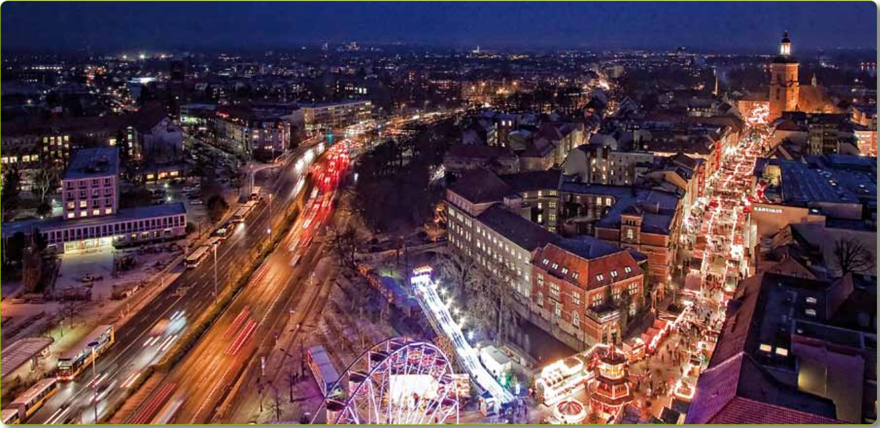
Herbststimmung auf den Rieselfeldern in Spandau. 360 Grad Panoramafotografie, zusammengesetzt aus 72 Einzelfotografien.