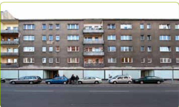
Spandauer Neustadt - Leerstand Neuendorfer Straße

Spandau. Seit dem April 2010 ist die zwischen | nutzungs | agentur im Projekt „Gewerbe- und Leerstandsmanagement“ in der Spandauer Neustadt tätig. Das Quartier wird von Leerstand und einem in der Gesamtheit wenig abwechslungsreichen Waren- und Dienstleistungsangebot bestimmt. Innovative und kreative Nutzungen bringen frischen Wind in die Gewerbelandschaft, stärken lokale Ökonomie und stabilisieren so das Quartier. Nach den ersten Monaten der Bestands- und Kontaktaufnahme mit Vermietern und Eigentümern mit Leerstand in der Spandauer Neustadt und Besichtigungen mit Rauminteressenten fällt zur Adventszeit der Startschuss für die erste temporäre Nutzung im Quartier. Gemeinsam mit Benjamin Andreas vom Jugendhaus