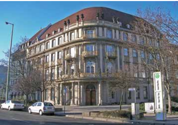
Ephraim-Palais im Nikolai Viertel

Allein der Satz „Det war sein Milljöh“ reicht aus zu erklären um wen es sich handelt. Von Heinrich Zille ist die Rede, dem Berliner Künstler, der liebevoll „Pinselheinrich“ oder „Armeleutemaler“ von den Berlinern genannt wurde.